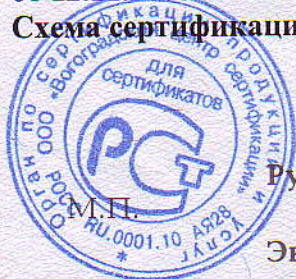
Схема сертификации 2, 4.

НА ОСНОВАНИИ акта оценки оказания услуг общественного питания от 12.02.2009 № УО/4, протокола испытаний ИЛЦ Волгоградский филиал ФГУЗ "Федеральный центр гигиены и эпидемиологии по железнодорожному транспорту" (№ РОСС RU.0001.511893) от 12.11.2008 № 1074.